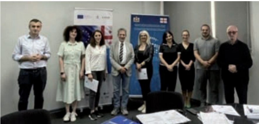
სააგენტოს სტანდარტიზაციის დეპარტამენტის თანამშრომლების მონაწილეობა QMS აუდიტორის - წამყვანი აუდიტორის ტრენინგის კურსში

ხარისხის მართვის სისტემის (QMS) აუცილებელი დოკუმენტაციის შემუშავება და QMS-ის დანერგვა წარმოადგენს ტვინინგ პროექტის ერთ-ერთ კომპონენტს, რომელშიც მონაწილეობენ საქართველო, იტალია და ესპანეთი. აქედან გამომდინარე, QMS დოკუმენტაცია, რომელიც შესწორებულია წინასწარი შეფასების შემდეგ, განხილული იქნა და განისაზღვრა QMS-ის განხორციელების შემდეგი ნაბიჯები.