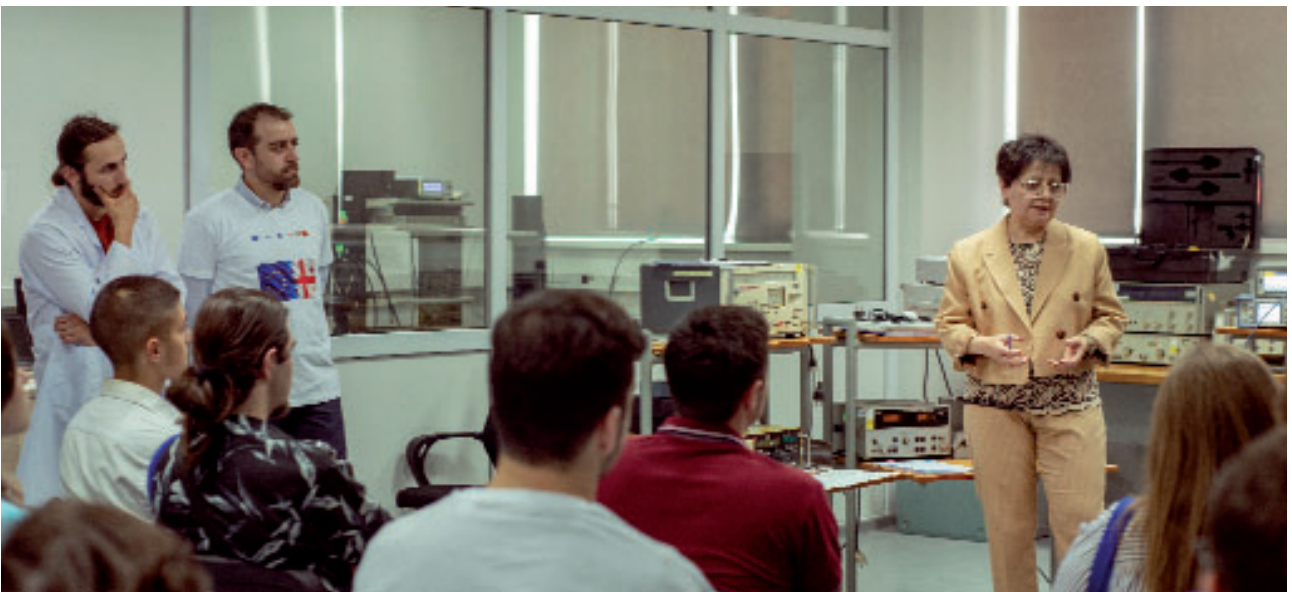
ღია კარის დღის ღონისძიების ფარგლებში სკოლის მოსწავდეები სტუმრობდნენ სააგენტოს რადიოფიზიკის, ოპტიკისა და აკუსტიკის ეტალონურ განყოფილებას

იმავე დღეს, ღია კარის ღონისძიებამ საშუალება მისცა ბიზნესის, აკადემიური და სამეცნიერო სექტორის წარმომადგენლებს გაცნობოდნენ სააგენტოს სერვისებს და მიეღოთ თეორიული და პრაქტიკული ინფორმაცია ეროვნული სააგენტოს ექსპერტებისგან შემდეგ დარგებში: სტანდარტიზაცია, ელექტროენერჯია, თერმომეტრია, მასა, წნევა, გამოსხივება, აკუსტიკა, გეომეტრიული გაზომვები, მექანიკა და ფიზიკური- ქიმია.