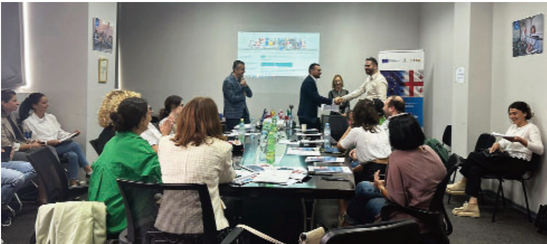
სემინარი დაინტერესებული მხარეებისთვის 2009/48/EC სათამაშოების უსაფრთხოების შესახებ დირექტივის მიხედვით.

საპროექტო აქტივობის ფარგლებში: 3.3.3 - ყოველმომცველი ტრენინგი/სემინარები სათამაშოების უსაფრთხოების შესახებ დირექტივის (2009/48/EC) შესაბამისი სტანდარტების გამოყენების შესახებ, წარმატებული სემინარი დაინტერესებული მხარეებისთვის ჰარმონიზებული და მასთან დაკავშირებული სტანდარტების შესახებ /48/EC სათამაშოების უსაფრთხოებაზე ჩატარდა 2009 წელს.