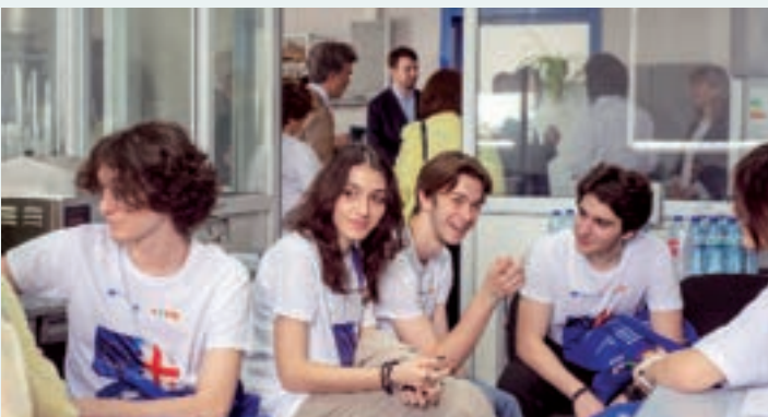
ღია კარის დღის ღონისძიების ფარგლებში სტუდენტები სტუმრობდნენ სააგენტოს ფიზიკურ-ქიმიურ ეტალონურ განყოფილებას

დაბორატორიებს ესტუმრნენ სკოლის მოწავდეები, გამორჩეული სტუმრები და სტუდენტები უნივერსიტეტებიდან. ისინი ასევე დაესწრნენ გახსნისა და დახურვის ცერემონიას, რამაც ეს დღე დატვირთული და საინტერესო გახადა პროექტისა და სააგენტოსთვის. ორმაგმა ღონისძიებამ წარმატებით ჩაიარა და მიაღწია ყველა დასახულ მიზანს.