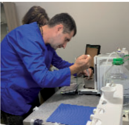
EURAMET-ის გარე შეფასება მასობრივი და დაკავშირებული რაოდენობების ეტალონურ განყოფილებაში