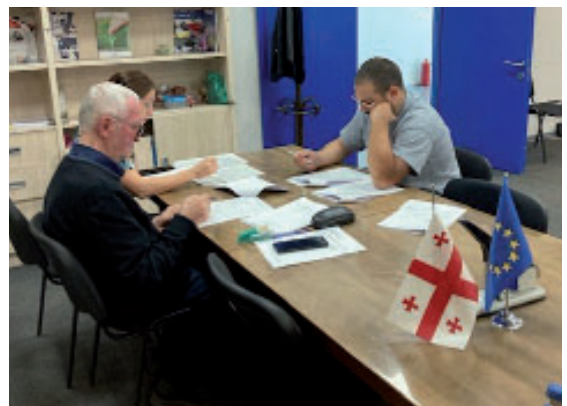
სააგენტოს სტანდარტიზაციის დეპარტამენტის თანამშრომლების მუშაობის პროცესი QMS აუდიტორის - წამყვანი აუდიტორის ტრენინგის კურსში

კურსი დიდი ინტერესით მიმდინარეობდა. კურსის დასასრულს მონაწილეებს, რომლებმაც წარმატებით დაასრულეს ორსაათიანი გამოცდა, გადაეცათ საერთაშორისოდ აღიარებული QMS აუდიტორის სერტიფიკატი.