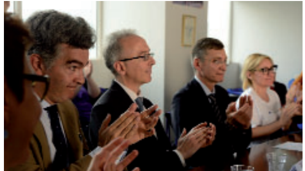
ევროკავშირის GEOSTM-ის შუადღური კონფერენციის მონაწილეები დაძმობილების პროექტში.

ევროკავშირის დაძმობილების პროექტის შუადღურ კონფერენციაზე წარმოდგენილი იყო პროექტის მიერ მიღწეული შედეგები და მათი გავრეცხვა/რეგვიანტრობა სააგენტოს დაინტერესებული მხარეებისათვის. ამ მნიშვნელოვან კონფერენციას ესწრებოდა იტალიის ედრი საქართველოში, ესპანეთიდან საქართველოში საქმეთა დროებითი რწმუნებული, ევროკავშირის დედეგაცია (EUD) და პროგრამის ადმინისტრირების ოფისის წარმომადგენელი ENI ქვეყნებში (PAO).