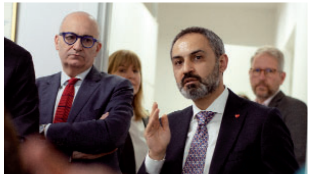
საქართველოში ევროკავშირის დედეგაციის წარმომადგენლის მინდი ბოუკოვას მისასაღმებელი სიტყვა