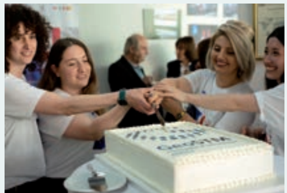
სამედიო ტორტის გაჭრა სააგენტოს ღია კარის დღის ღონისძიების აღსანიშნავად